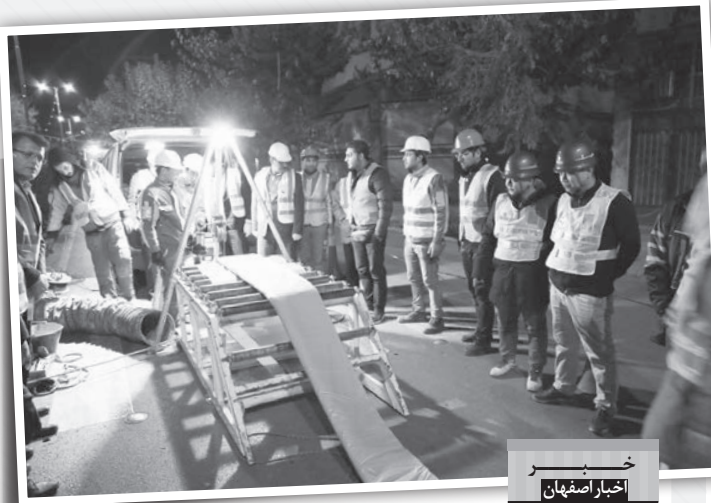
خبر اخبار اصفهان

مدیر عامل شرکت آب و فاضلاب استان اصفهان بیان داشت: این بسته آموزشی در چهار گروه و طی چهار هفته برگزار خواهد شد که میهمانانی از شرکت مهندسی