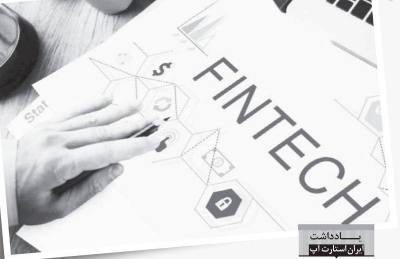
یادداشت ایران استارت‌آپ

در برخی موارد نیز استارت‌آپ‌ها در آمد خود را از کسب‌وکارهای دیگر کسب می‌کنند؛ مثلاً از طریق دریافت پول بابت تبلیغات یا رایج مشتری یا یک وام‌دهنده یا حتی یک فروشگاه خواربارفروشی یا فروش جایگاه تبلیغاتی یا تبلیغات مبتنی بر پرداخت، براساس کلیک. به‌عنوان مثال استارت‌آپ پراپل اپلیکیشنی دارد که به دریافت‌کنندگان کوپن غذایی