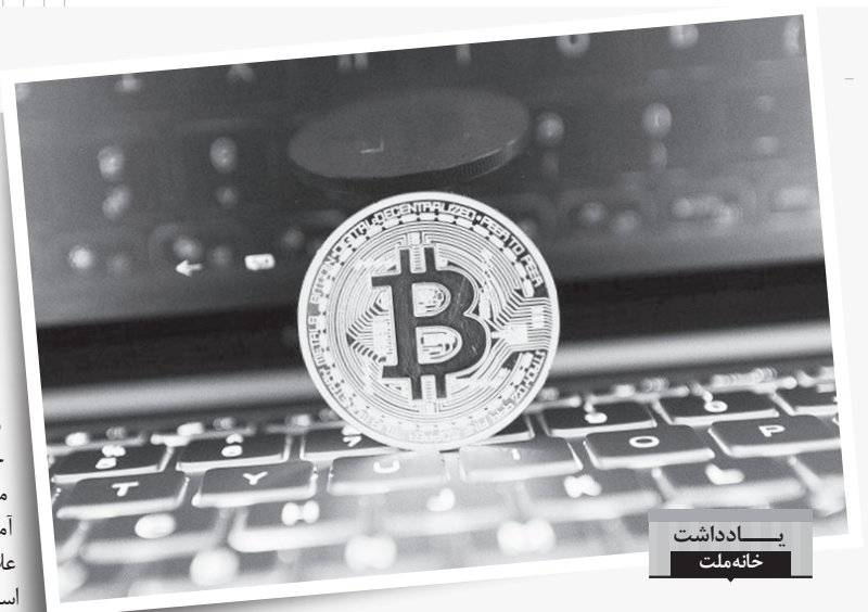
پادداشت خانه ملت

علاوه بر این، سیستم بانکی کشور هلند، از بیت کوین به عنوان راهی برای ارتقای تکنولوژی خود و کاهش هزینه ها یاد می کنند. میزبانی منظم شرکت های جهانی بیت کوین نظیر بیت پی در هلند به دفعات صورت می گیرد؛ علاوه بر هلند، فنلاند، کانادا، استرالیا و انگلستان نیز از قانونی بیت کوین را به عنوان یک سرویس مالی معتبر و قانونی اعلام کرده اند. با وجود آنکه هیچ برنامه رسمی برای استفاده از ارزهای دیجیتال در داخل ایران طراحی نشده است وزارت خزانه داری ایالات متحده آمریکا با رصد ترانکش های ایرانیانی که در صرافی های متمرکز ارزهای دیجیتال اقدام به خرید و فروش می کنند، دولت ایران را متهم به استفاده از ارزهای دیجیتال برای دور زدن تحریم های مالی کرده و از صرافی های آمریکایی عرشه کننده ارزهای دیجیتال خواسته تا از فروش کریپتو کانسبی به شهر و ندان و دولت ایران خودداری کنند.