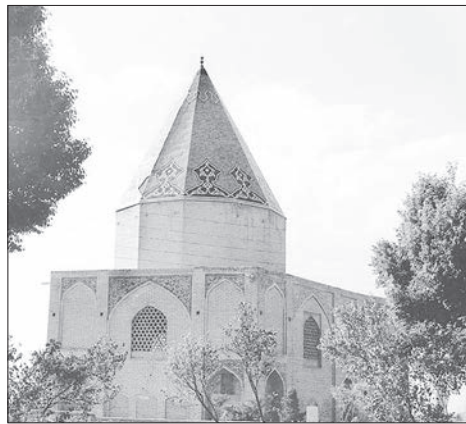
Baba Roknedin Tomb