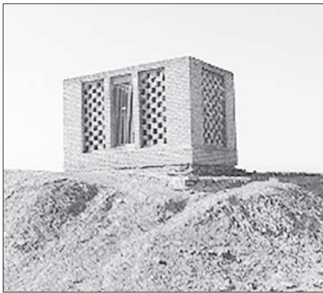
Tomb of Amir Oveis