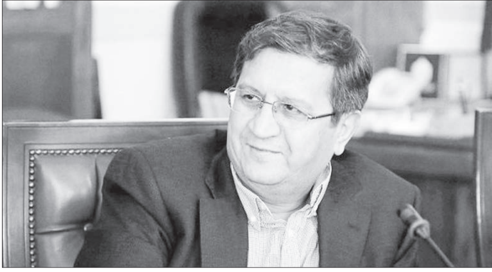
Governor of the Central Bank of Iran (CBI) Abdolnaser Hemmati said that the United States failed in sanctioning Iranian oil.

Today, it has been clear for everyone that the United States has been defeated in sanctioning Iranian oil and minimizing it into zero level completely under any pretext. He made the above remarks on his Instagram page and said, "with granting waiver by the United States to various countries gradually for buying Iranian oil, trade and revenue status of the country will be identified."