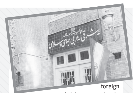
foreign ministry experts in Oman are negotiating with their American counterparts." "Oman has become a "private place" for American and British officials to get access to Iran," claimed the member of the National Security Commission.