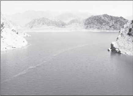
در سنی صورت نگرفته است

وی تأکید کرد: متولیان و عوامل تاثیرگذار در ساماندهی مشاغل شهری شامل استانداردی، فرمانداری، شورای اسلامی شهر، شهرداری، اتاق اصناف، شرکت شهرک‌های صنعتی، سازمان صنعت، معدن و تجارت، دانشگاه علوم پزشکی، اداره کل حفاظت محیط زیست، اداره کل راه و شهرسازی و سازمان جهاد کشاورزی است. وی با اشاره به مهم‌ترین چالش‌های ساماندهی مشاغل شهری اظهار کرد: تعدد قوانین و دستورالعمل‌ها، ماهیت بینابینی و چندجانبه فعالیت‌های ساماندهی و همچنین تعدد متولیان، عوامل ذی‌نفع و ذی‌نفع از جمله این چالش‌ها به‌شمار می‌رود. مدیرعامل سازمان ساماندهی مشاغل شهری و فرآورده‌های کشاورزی شهرداری اصفهان افزود: گلوگاه‌های ایجاد نابسامانی در مشاغل شهری شامل افزایش جمعیت و مهاجرت، رشد فزاینده واحدهای صنفی فاقد کیفیت، نبود هماهنگی شهرداری و اتاق اصناف در ارائه پروانه کسب، عدم وجود منابع مالی پایدار در شهرداری‌ها و اتکا به کسب درآمدهای ناپایدار و کتاب‌است علاوه بر آن وجود نداشتن ضابطه در خصوص نحوه استقرار و تراکشن انواع کاربری‌ها به‌ویژه کاربری تجاری در سطح شهر، صدور پروانه تجاری بدون توجه به نوع فعالیت قابل استقرار و زیرساخت‌های لازم و پرداختن به موضوع ساماندهی مشاغل بعد از شکل‌گیری کامل آن‌ها به این امر دامن می‌زند.