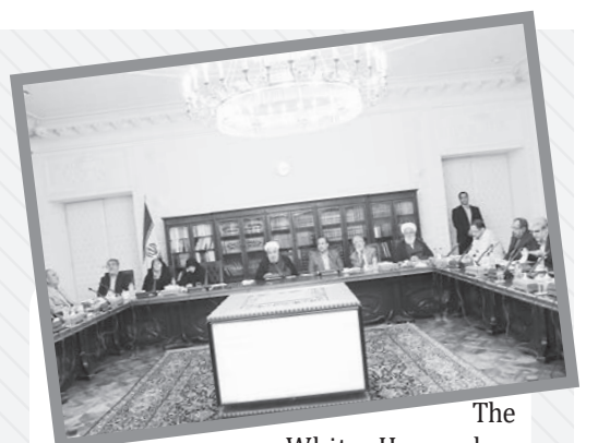
The White House has also announced plans to drive Iranian oil exports down to zero and launch a campaign of "maximum economic and diplomatic pressure" on Iran.

The former US embassy building in Tehran is known by Iranians as the "Den of Espionage". Meanwhile, the US government has decided to slap what is calls crippling sanctions on Iran on November 4 this year. On May 8, US President Donald Trump pulled his country out of the nuclear deal known as the Joint Comprehensive Plan of Action (JCPOA), which was achieved in Vienna in 2015 after years of negotiations among Iran and the Group 1+5 (Russia, China, the US, Britain, France and Germany).