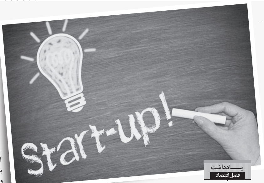
یادداشت فصل اقتصاد

نگاه دقیقی به حساب های مالی تان داشته باشید.