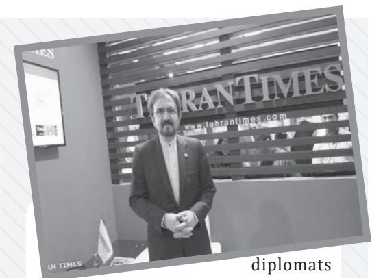
diplomats from Canada.

Six years ago, the previous Conservative government of Canada abruptly severed its diplomatic relations with Iran, shuttering its embassy in Tehran and expelling Iranian