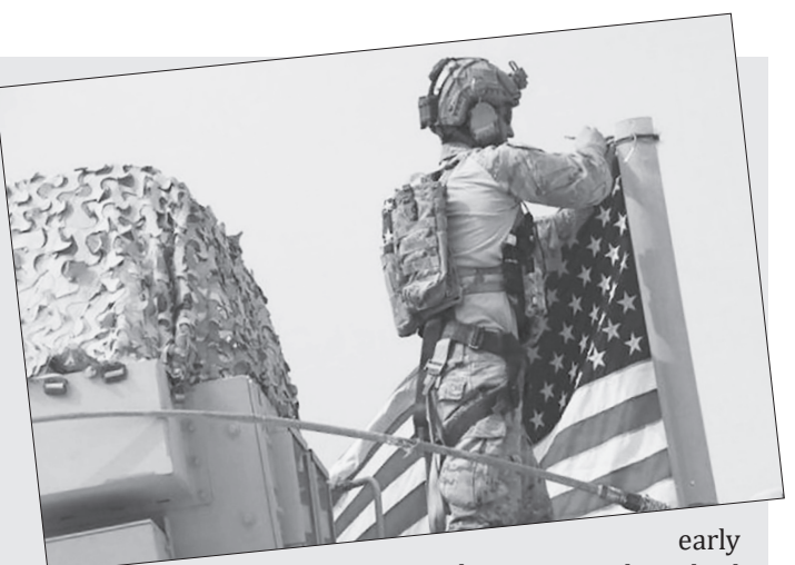
early last year that had ordered withdrawal of all US-led forces.

The announcement came after constant pressure from many Iraqi factions, influential personalities, and the general public on the country to follow up a law passed by parliament