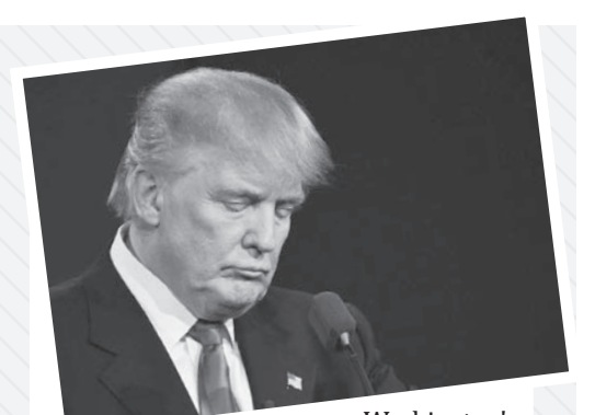
Washington's policy towards Iran has prompted US officials to think twice about their approach and consider waivers on Iranian crude sanctions.

The London-based newspaper, The Times, wrote on Friday, the staunch resistance to