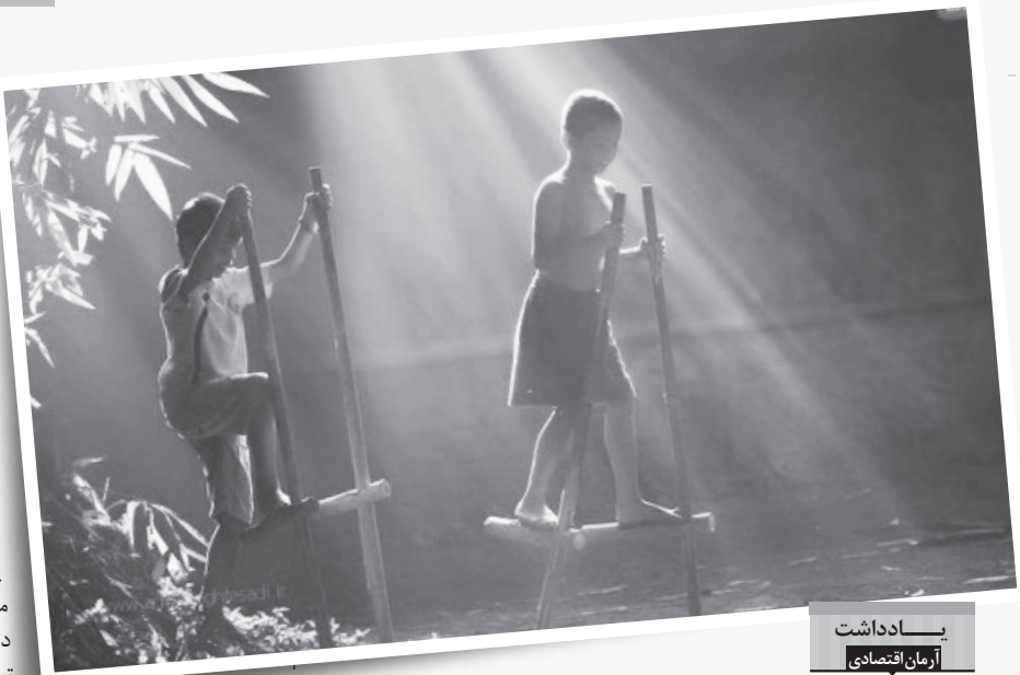
یادداشت از زمان اقتصادی

نرخ ثبت‌نام اندونزی‌بانی‌ها در دوره آموزش عالی تنها ۲۷ درصد است که نسبت به کشورهای توسعه یافته (با رقم ۷۴ درصد) آماری بسیار پایین و تکان دهنده است. میانگین کل هزینه