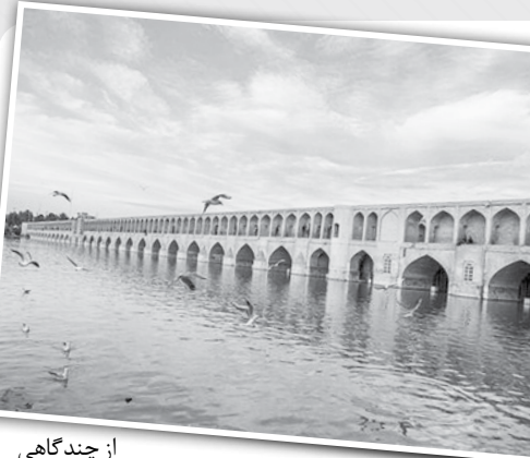
از چند گاهی

شوک رطوبتی ببینند، تصریح کرد: موضوع مهم دیگر در بحث باز چرخانی آب و پل‌های تاریخی این است که باید میزان حجم آب، میزان و سرعت حرکت آن مشخص باشد چراکه مصالح به کار رفته در این پل‌ها برای حجم و میزان سرعت خاص آب طراحی شده است.