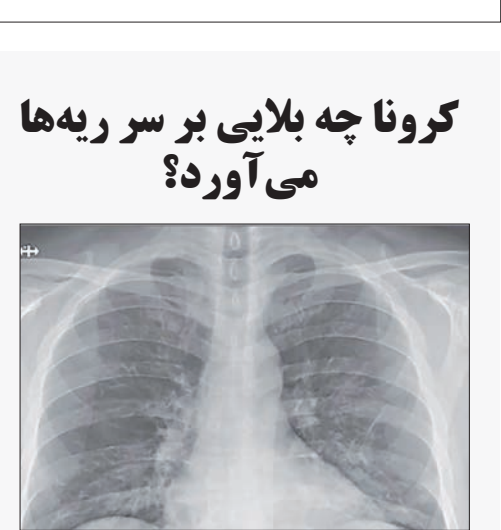
کرونا چه بلایی بر سر ریه‌ها می‌آورد؟