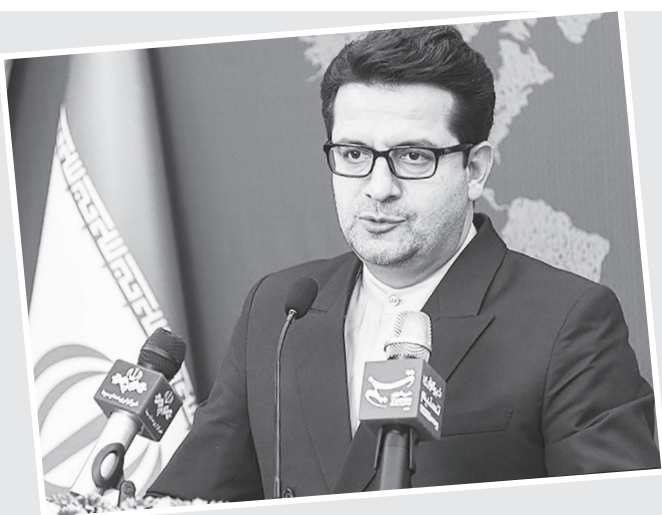
In the early hours of Wednesday, January 8, the Islamic Revolution Guards Corps (IRGC) targeted the US airbase of Ain al-Assad in retaliation for the US move.

The White House and the Pentagon claimed responsibility for the assassination of General Soleimani in Iraq, saying the attack was carried out at the direction of US President Donald Trump.