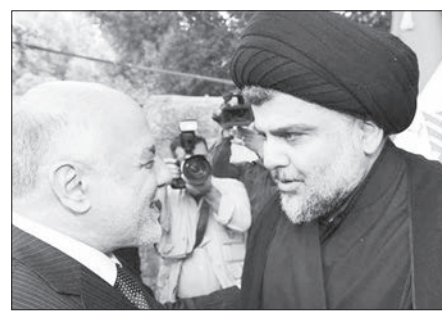
The two leading groups in Iraq's parliament Saturday called on Prime Minister Haider

al-Abadi to resign, after lawmakers held an emergency meeting on unrest shaking the country's south.