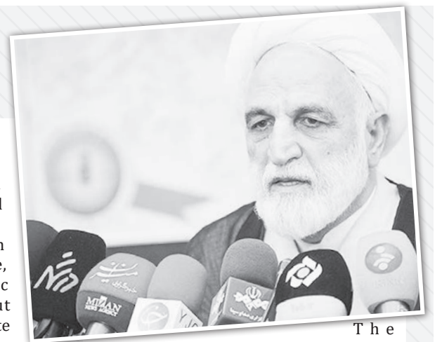
The Leader then urged the Judiciary to fully inform people about its measures to tackle economic corruption, saying the judicial system should let people realize the authenticity of its anti-corruption measures and turn the threats into opportunities.

In a letter to the top judge in August, Ayatollah Khamenei wrote, "Punishment of convicts of economic corruption must be carried out urgently and justly, and appropriate meticulousness must be given to the designation of sentences by courts." Earlier, the Leader described "outright and unequivocal" treatment of economic corruption as one of the Judiciary's major duties, stressing that confronting economic corrupts must be decisive and effective.