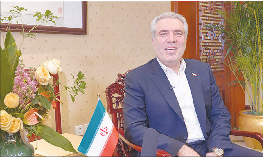
وزیر میراث فرهنگی، صنایع دستی و گردشگری