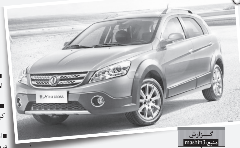
گزارش منبع: mashin3

دانگ فنگ H۳۰ کراس مدتی است توسط ایران خودرو و در ایران تولید و عرضه می‌شود و ایران خودرو هم آینده خوبی را برای این محصول در بازار فعلی پیش‌بینی کرده است. وقتی از نمای جانبی به دانگ فنگ H۳۰ کراس نگاه می‌کنیم، شاهد دماغه‌ی کشیده‌ای هستیم که شاید در نگاه اول احساس کنیم که با اتاق ماشین تناسب ندارد. فلاپ مشکی رنگی که از سپر جلو تا سپر عقب کشیده شده، بروی گلگیرها و قسمت زیرین درها به وضوح