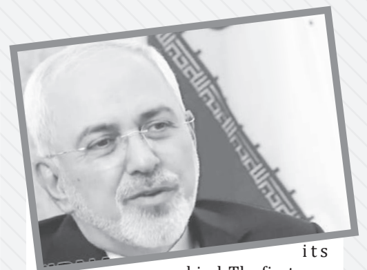
its kind. The first was held in Tehran in April 2018, hosted by Allameh Tabatabaee University.

We have 15 neighbors which is a great potential for our country. Iran is located in a geographically sensitive place. Iran is the juncture of the east and west, north and south, which is important geographically.' Elsewhere in his message, Zarif said the precision and importance of the leader's remarks on the issue of neighbors in foreign policy has opened a new chapter both in practical policy and the field of research. The Mashad conference is the second of