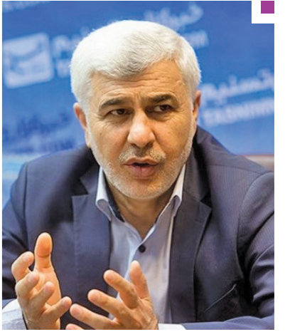
امام جمعه اردستان: