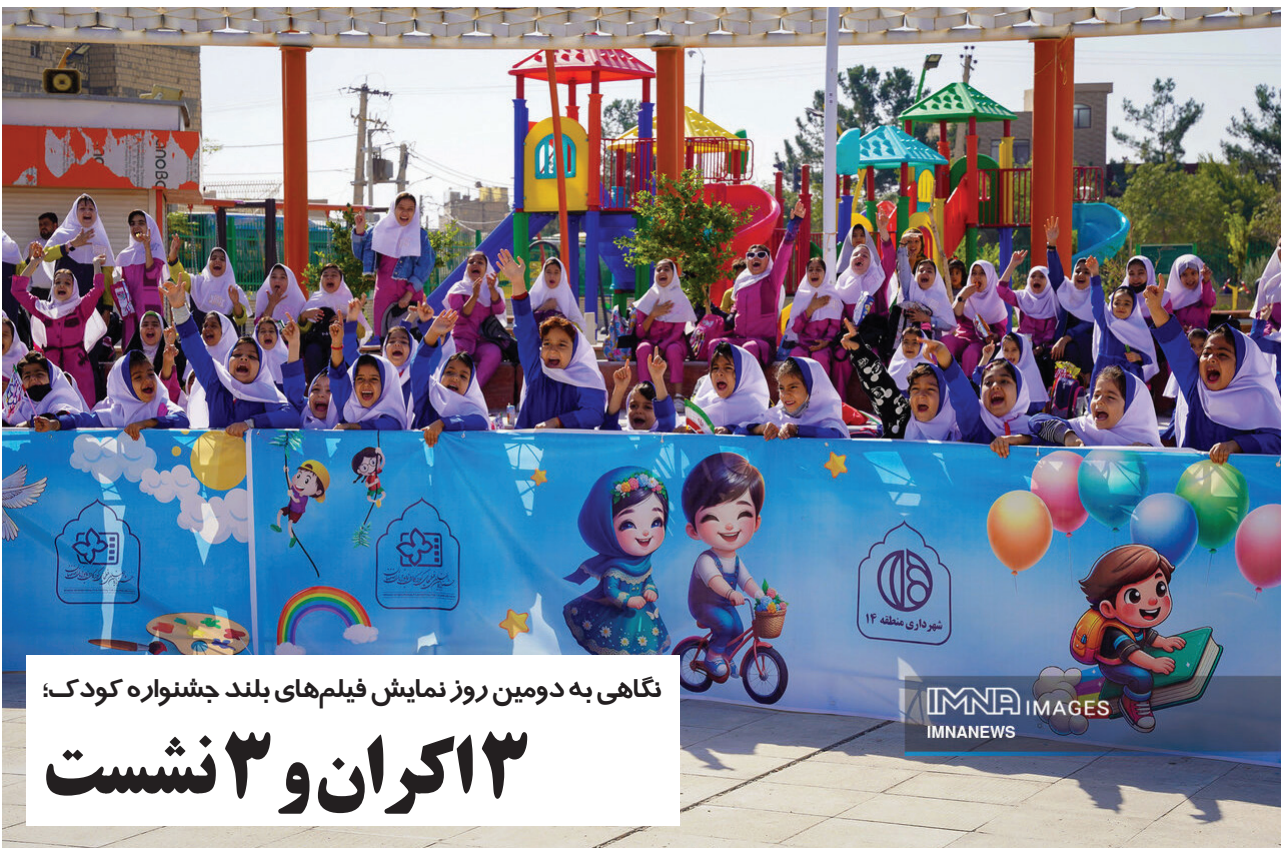
نگاهی به دومین روز نمایش فیلم های بلند جشنواره کودک: ۱۳ کران و ۳ نشست