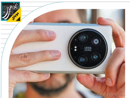
مشخصات احتمالی دوربین شیائومی 15 اولترا، لو رفت؛

«من آن‌ها را حتی یک بار هم شارژ نکرده بودم، دستگاه هنگام عرضه حدود ۳۶ درصد شارژ داشت. وقتی دوستانم آن‌ها را قرض گرفت و از آن‌ها استفاده کرد، هدفون در گوش او منفجر و باعث ناشنوایی دائمی‌اش شد. ما گزارش دکتر را در مورد این وضعیت داریم.» تصاویر ارسال‌شده در فروم سامسونگ نشان می‌دهد فقط هدفون چپ منفجر شده. به نظر می‌رسد منشأ انفجار نوک ایرباد باشد. اگر منشأ باتری بود، ایرباد بیشتر آسیب می‌دید و احتمالاً کل آن ذوب می‌شد. تاکنون هیچ حادثه مشابه دیگری گزارش نشده و شاید این انفجار استثنا بوده باشد. وقتی این کاربر به نمایندگی سامسونگ مراجعه کرده، نمایندگی فقط ایرباد جدیدی به او داده و ادعای انفجار را نپذیرفته. آن‌ها نتوانستند از عامل بروز این مشکل هم سر دریاورند. انتشار چنین خبری می‌تواند باعث شود کاربران Galaxy Buds FE به محصولی که خریدند، بدگمان بشوند، حتی از آن استفاده نکنند.