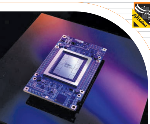
اینتل مشخصات تراشه هوش مصنوعی Gaudi 3 را معرفی کرد؛

برخی کارشناسان معتقدند هوش مصنوعی می‌تواند با افزایش کارایی و کاهش هزینه‌ها، راه‌حلی برای رفع نابرابری اقتصادی ارائه دهد و در نهایت موجب بهبود دسترسی به خدمات اساسی و ایجاد فرصت‌های مؤثر برای بهبود سطح زندگی مردم شود. در مقابل، برخی دیگر معتقدند این فناوری بخش عمده‌ای از مشکلات فقیرترین و کم‌برخوردارترین افراد جهان را تشدید و دسترسی به ثروت و منابع را فقط برای جمعیت اندکی ممکن خواهد کرد. در این میان، چه کسی درست می‌گوید؟ این سؤال واقعاً پیچیده است و برای رسیدن به پاسخ درست باید جنبه‌های زیادی را در نظر بگیریم. در ادامه نظر موافقان و مخالفان استفاده از AI برای مقابله با نابرابری اقتصادی را بیان خواهیم کرد.