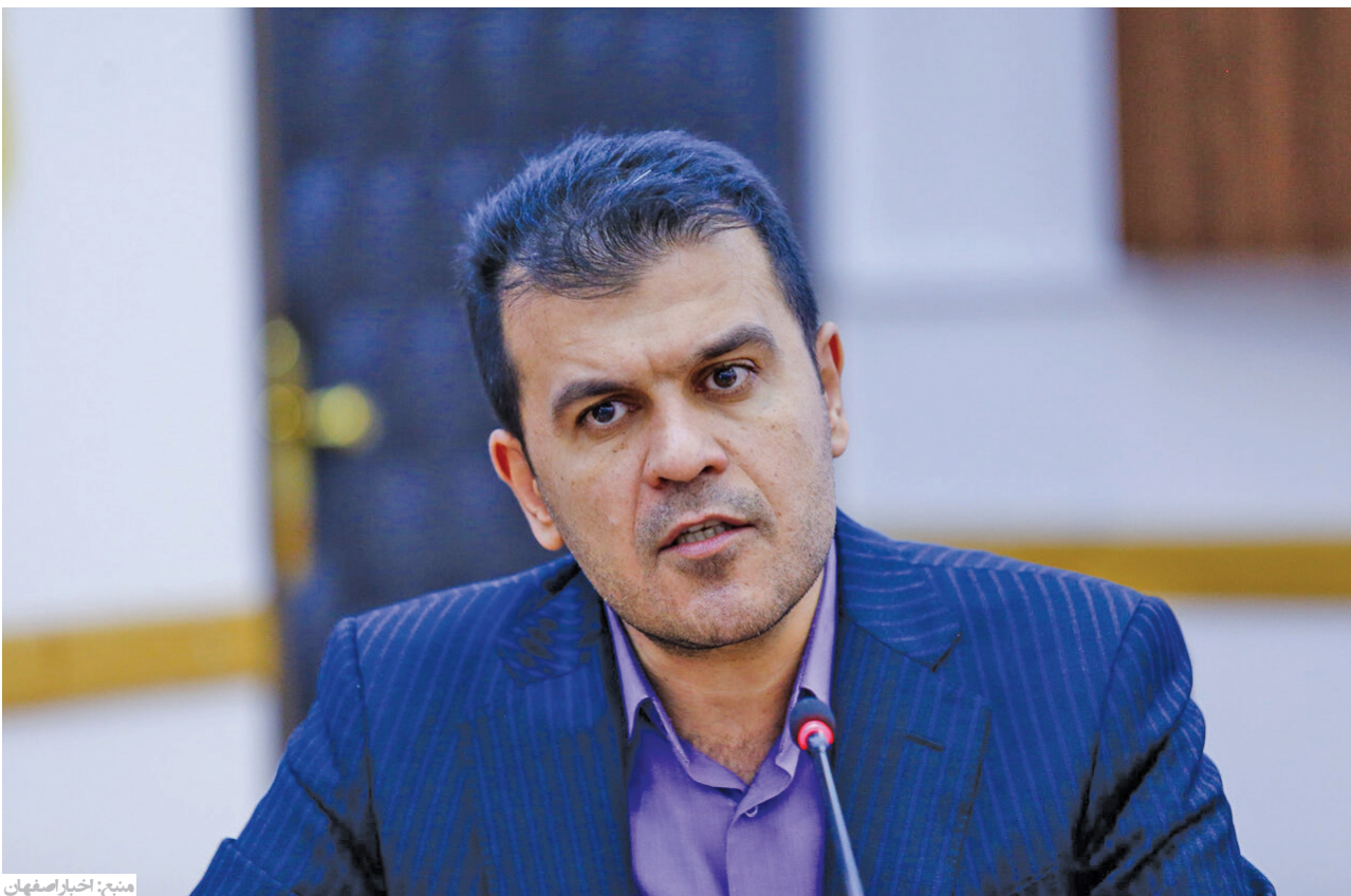
معاون علمی و فناوری رییس جمهور: