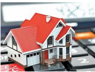
هشدار جدی به مالکانی که بیش از ۵ خانه خالی دارند؛