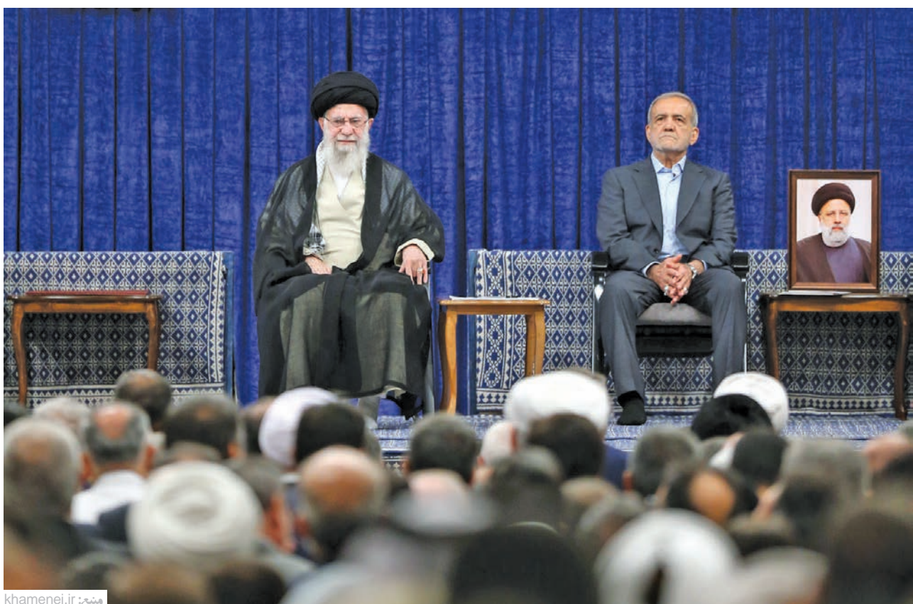
پزشکیان در مراسم تنفیذ: