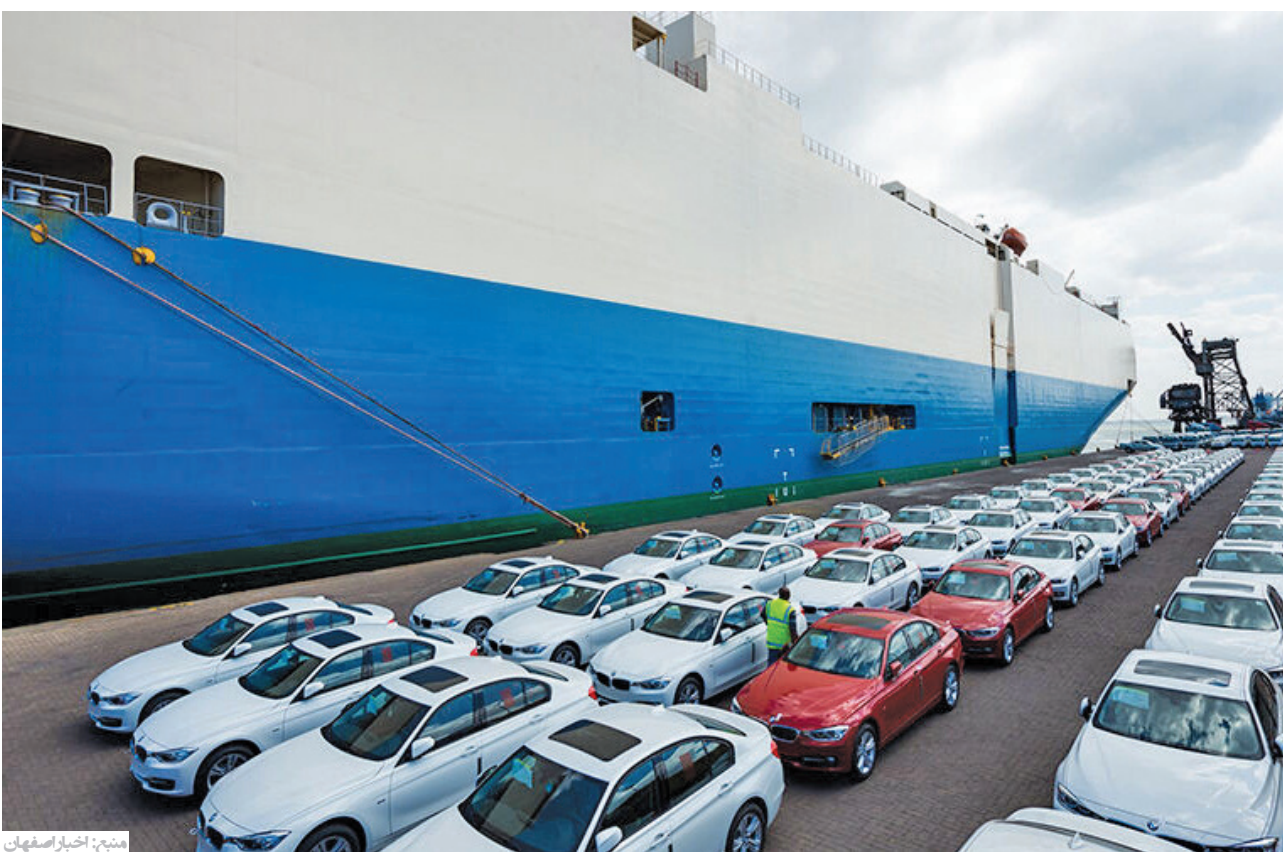
قیمت خودرو کاهش شد: