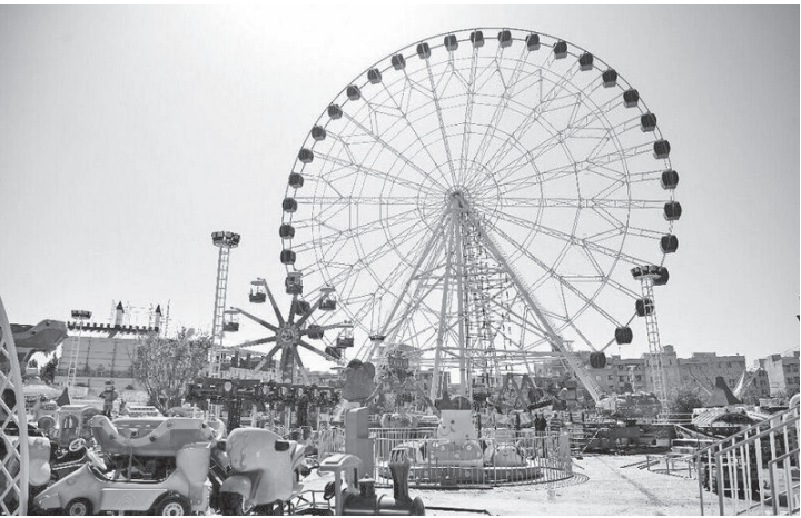
استاندارد ندا شدند تا تاریخ بازرسی آنها تمام شده و مالکان برای تمدید اقدام نکرده بودند. وی ادامه داد: ۱۶ احطاریه حقوقی نیز برای تجهیزات