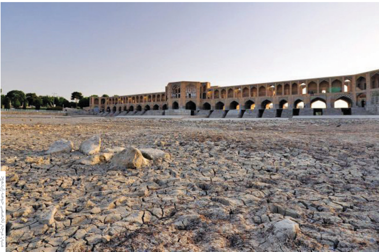
کارشناس اداره کل منابع طبیعی اصفهان مطرح کرد: