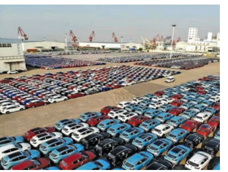
لایحه الحاق تبصره ۳ به ماده ۴ قانون ساماندهی صنعت خودرو تحت عنوان «حذف الزام انتقال فناوری برای واردکنندگان خودرو»

به مجلس شورای اسلامی ارسال شد. به گزارش تجارت نیوز، لایحه الحاق تبصره ۳ به ماده ۴ قانون ساماندهی صنعت خودرو تحت عنوان «حذف الزام انتقال فناوری برای واردکنندگان خودرو» طی نامه شماره ۶۰۸۷۲ مورخ ۱۳۰۳/۰۴/۱۳ برای انجام تشریفات قانونی به مجلس شورای اسلامی ارسال شد. در این نامه که به امضای وزیر صمت و سرپرست ریاست جمهوری رسیده، آمده است: مقدمه توجیهی مطابق بند (۲) ماده (۴) قانون ساماندهی صنعت خودرو مصوب ۱۴۰۰، یکی از شرایط لازم برای واردات خودرو و انتقال فناوری است با این حال به عنایت به لزوم تسهیل واردات خودرو برای تنظیم بازار آن و انتظارات عمومی برای رفع محدودیت مزبور در زمینه واردات خودرو توسط اشخاص حقیقی و شرکتهای و مقرون به صرفه نبودن سرمایه گذاری برای