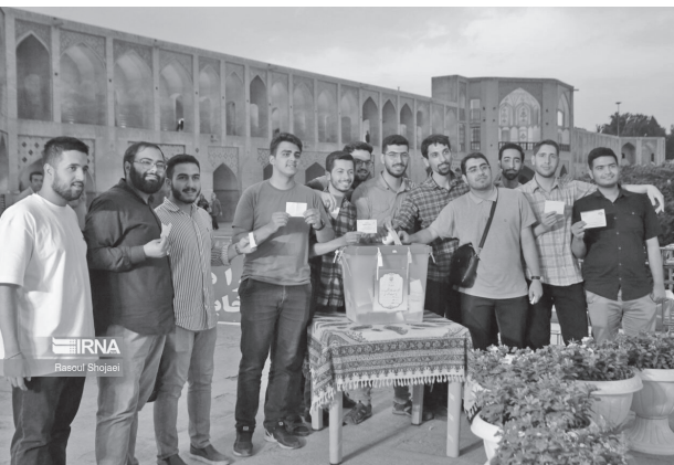
رئیس ستاد انتخاباتی رئیس جمهور منتخب در اصفهان، از حضور پرشور اهالی این استان در چهاردهمین دوره انتخابات ریاست جمهوری قدردانی کرد. به گزارش ایرنا، در متن پیام

زحمات فراوان و تلاش های پرثمر شما جلسه ویژه ای را با همراهی احتمالی رئیس جمهور منتخب و مردمی جناب آقای دکتر مسعود فریختگی شما گواه نهادینه بودن ارزش های الهی، عدالت، صداقت و اصول انسانی عزت و کرامت است. وی در پیام خود افزوده است: این حضور معنادار نوبدبخش آغاز راهی است که بی شک به انسجام ملی، توسعه اقتصادی، افزایش سرمایه اجتماعی، گسترش روابط بین المللی، ارتقای تاب آوری و اعتماد اجتماعی و افزایش رفاه می انجامد. رضایی، حضور ثمربخش مردم را سرمایه ای ارزشمند برای دولت چهاردهم دانست و تصریح کرد: با توجه به اینکه در طلیعه ماه محرم هستیم و تکریم حرمت سالار شهیدان بر همه ما لازم است، این شاهانه در فرصتی مناسب برای قدردانی از