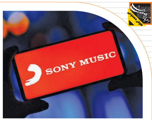
نامه هشدارآمیز سونی به ۷۰۰ شرکت:

پروژه Astra که اساساً هوش مصنوعی چندوجهی گوگل با قابلیت بینایی است و می‌تواند عملیاتی‌هایی مانند «استدلال»، برنامه‌ریزی و به‌خاطر آوردن» را انجام دهد، احتمالاً بلندپروازانه‌ترین اعلامیه هوش مصنوعی این شرکت در طول سخنرانی دو ساعته آن در شب گذشته بود. در واقع این سیستم از دوربین گوشی شما برای پاسخ‌دادن به سوالات و ارائه راه‌حل‌های موردنیاز استفاده می‌کند. برین در مورد پروژه Astra و اینکه از نظر قابلیت‌های خود با گوگل