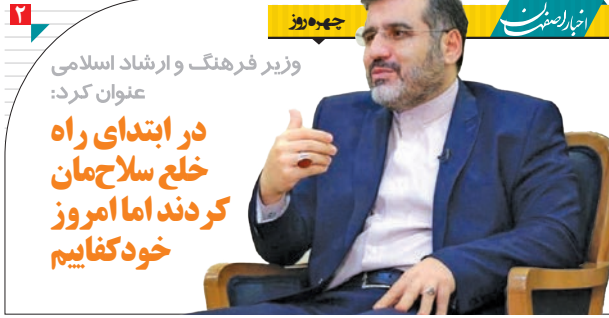
وزیر فرهنگ و ارشاد اسلامی عنوان کرد: در ابتدای راه خلع سلاحمان کردند اما امروز خود کفاییم

Iran's trade with neighbors exceeds $90 billion: FM