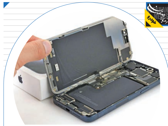
آیفون ۱۶ پرو مکس بهره‌مند می‌شود:

سونی با ارسال این نامه به‌دنبال محافظت از محتوای دارای مالکیت معنوی خود است که شامل آهنگ‌های ضبط‌شده، کارهای هنری، ابر داده، متن آهنگ‌ها و موارد دیگری می‌شود. البته این شرکت اعلام نکرده که نامه مذکور را به کدام ۷۰۰ شرکت ارسال کرده است. در نامه سونی آمده است: «ما از هنرمندان و ترانه‌سرایانی حمایت می‌کنیم که در پذیرش فناوری‌های جدید برای حمایت از هنر خود پیش قدم می‌شوند. تحولات حوزه فناوری اغلب مسیر صنایع خلاق را تغییر داده است و هوش مصنوعی احتمالاً این روند را ادامه خواهد داد. با این حال، این نوآوری باید تضمین کند که حقوق آهنگسازان و هنرمندان رعایت می‌شود». در این نامه همچنین از شرکت‌ها خواسته‌شده تا جزئیات مربوط به اینکه کدام یک از آهنگ‌های سونی موزیک تاکنون برای آموزش سیستم‌های هوش مصنوعی استفاده شده‌اند و نحوه دسترسی به آن‌ها را شرح دهند.