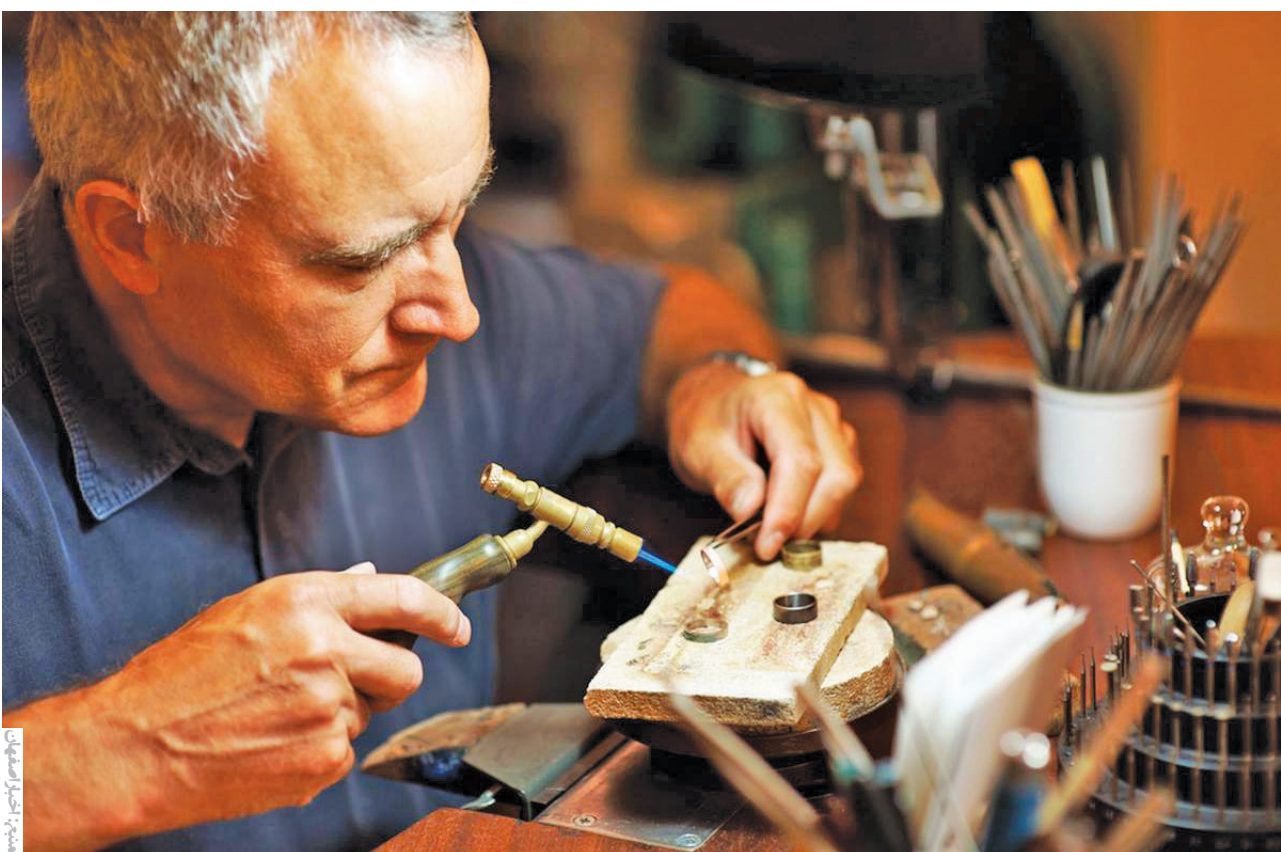
معاون صنایع عمومی وزارت صمت: