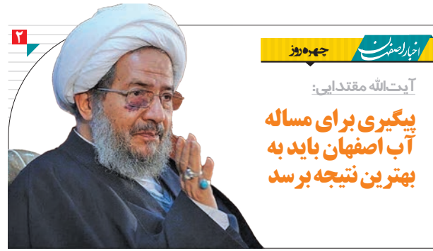
پیگیری برای مساله آب اصفهان باید به بهترین نتیجه برسد