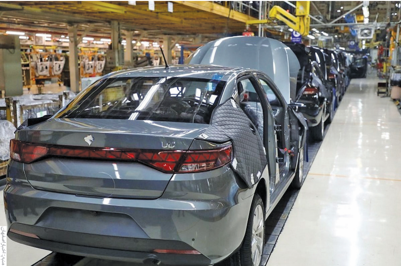
وزیر صنعت، معدن و تجارت: