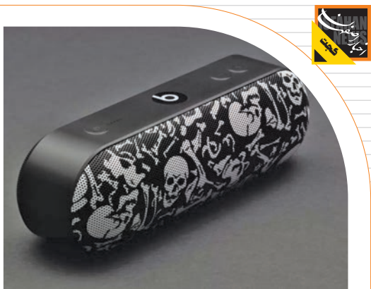
توسط بازیکن مشهور بسکتبال؛