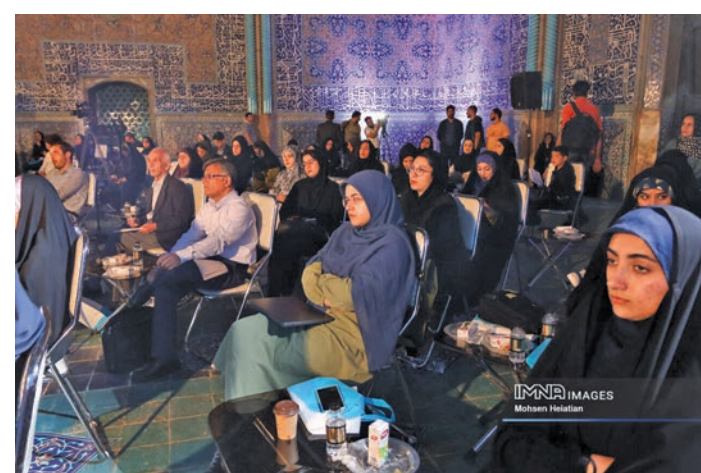
معاون شهردار و رئیس سازمان فرهنگی، اجتماعی و فرهنگی شهرداری اصفهان اعلام کرد: