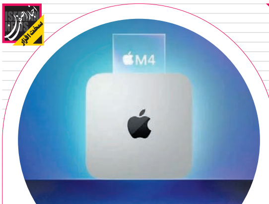
اپل جایگزین می‌کند؛