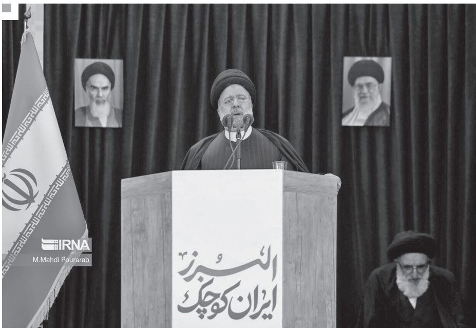
Following a series of trips to various provinces, Iranian President Ebrahim Raisi visited Alborz Province on Friday for the second time during his tenure to meet with provincial officials and follow up on under-way projects and the issues and problems of the