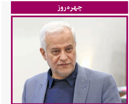
چهارم روز شهر دار اصفهان: ۱۴۰۰ چاه جذبی برای رفع آبرفتگی در شهر اصفهان حفر شد