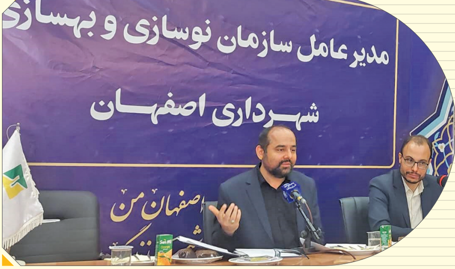
مدیرعامل سازمان نوسازی و بهسازی شهرداری اصفهان اعلام کرد: