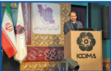
معان استاندار اصفهان: