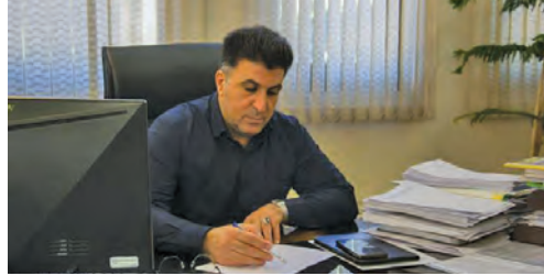
برای نخستین بار در اصفهان انجام گرفت: