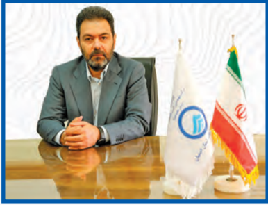
رونکرد کار جهادی مبتنی بر دانش آیفای استان اصفهان آغاز شد: