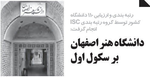
رتبه بندی و ارزیابی ۱۱۰ دانشگاه کشور توسط گروه رتبه بندی ISC انجام گرفت: