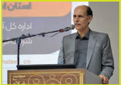
مدیرکل آموزش و پرورش استان اصفهان خبر داد: