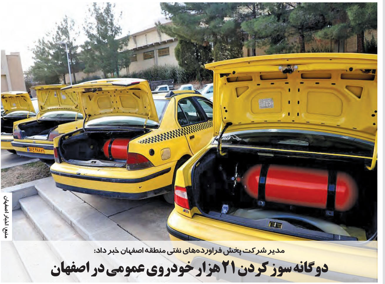
میچ: اخبار اصفهان

مدیر شرکت پخش فراورده‌های نفتی منطقه اصفهان خبر داد: