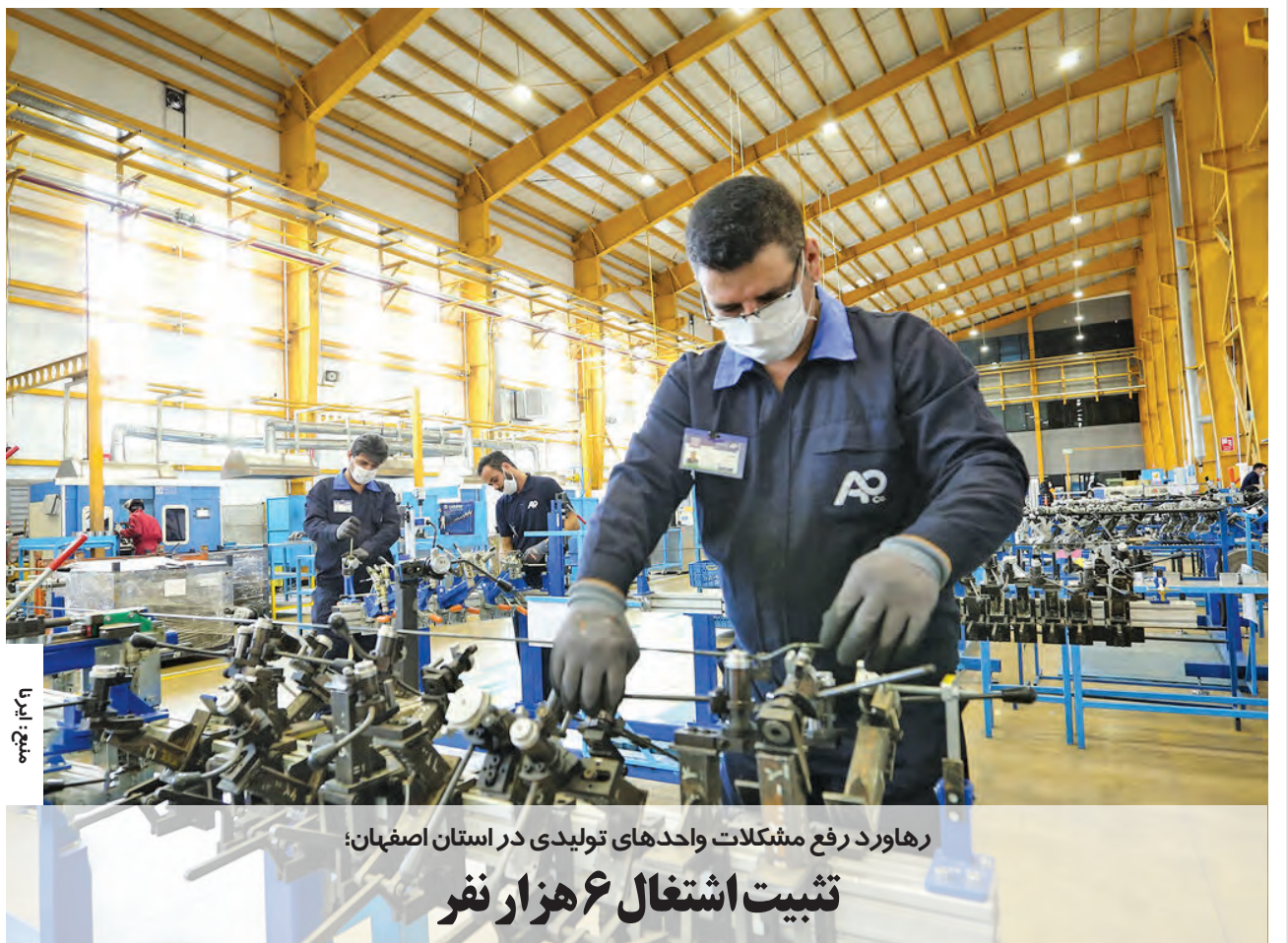
رهاورد رفع مشکلات واحدهای تولیدی در استان اصفهان؛