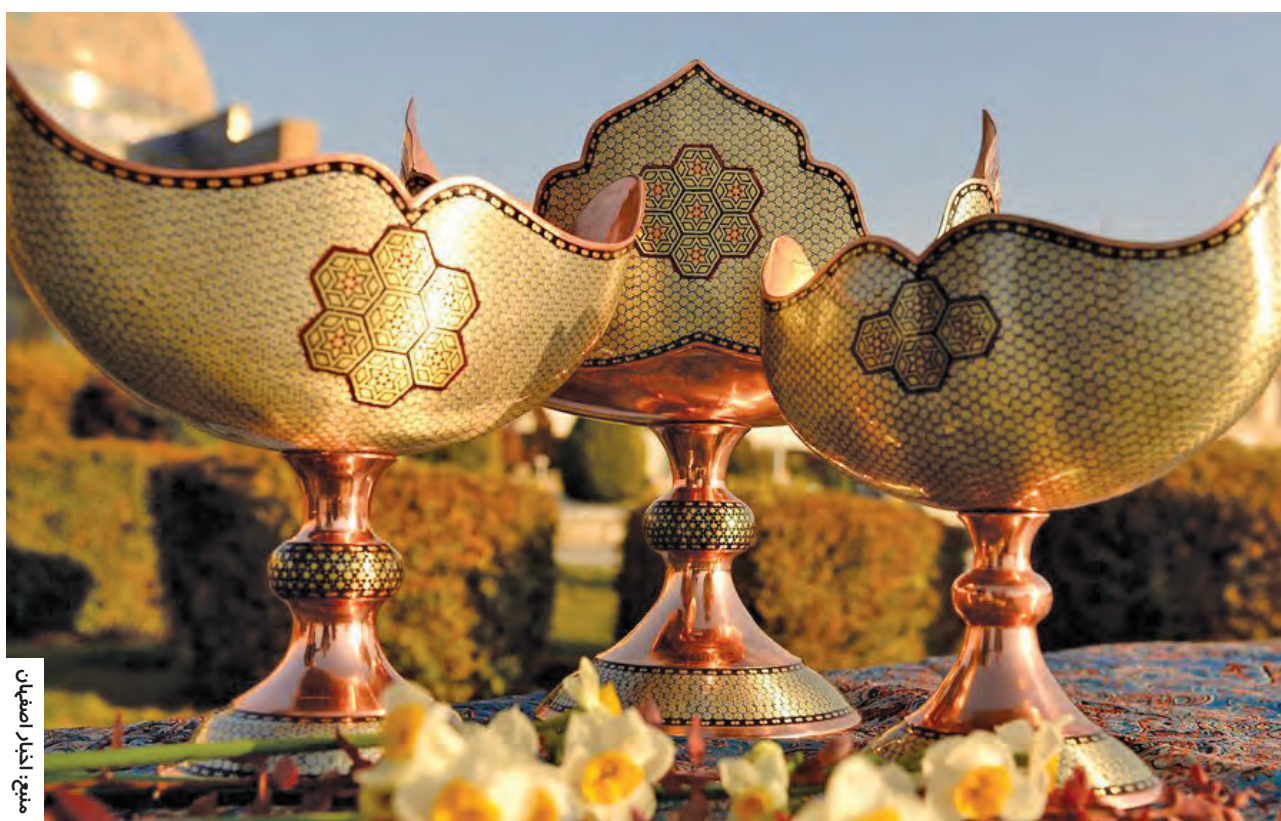
میغ: انبار اصفهان