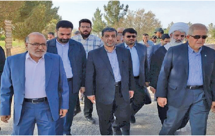
سازمان اوقاف و امور خیریه برای بهره‌برداری بهتر و بیشتر از آثار تاریخی و توسعه گردشگری

ضرغامی با اشاره به بازدید از مجموعه‌های تاریخی و مذهبی شهرستان نطنز، خاطر‌نشان کرد: این شهرستان توانایی بالایی در توسعه صنعت گردشگری دارد بنابراین با توجه به