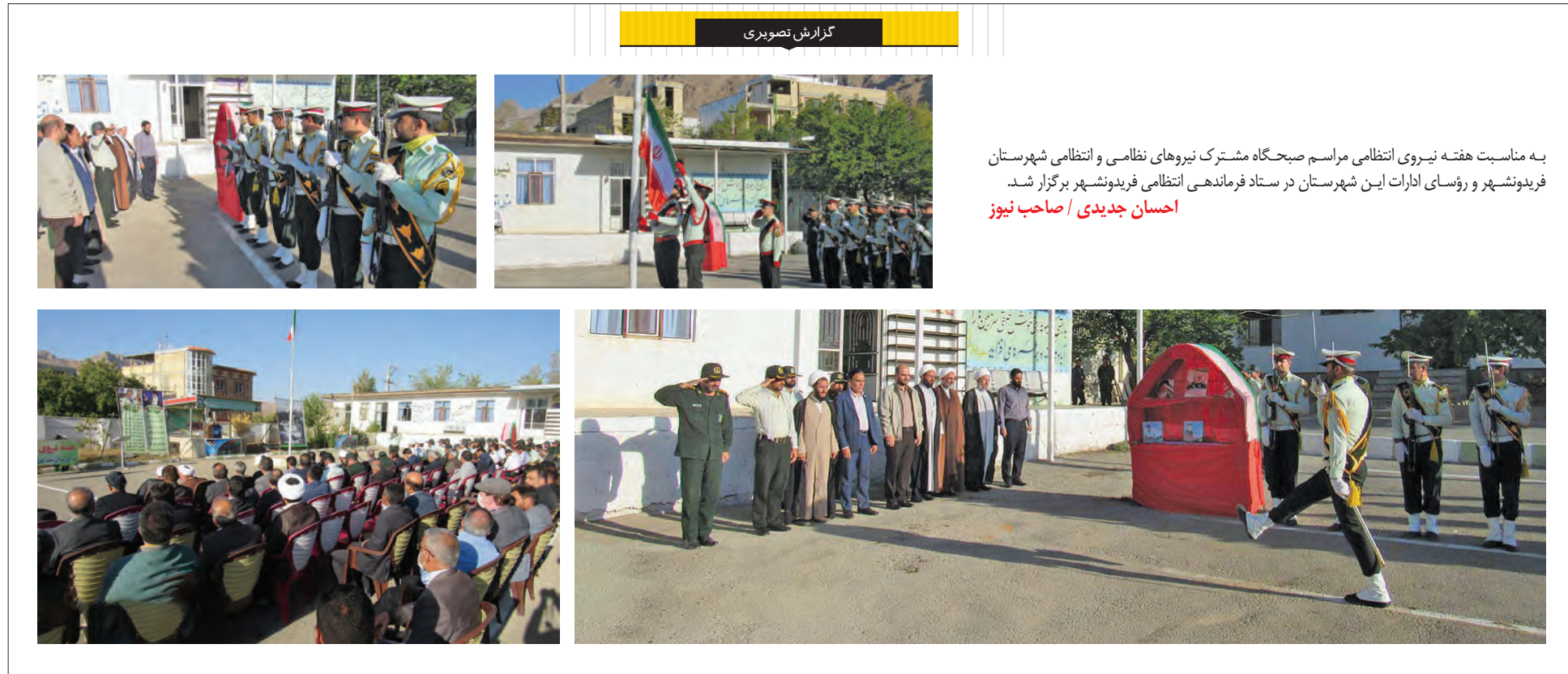
به مناسبت هفته نیروی انتظامی مراسم صبحگاه مشترک نیروهای نظامی و انتظامی شهرستان فریدونشهر و رؤسای ادارات این شهرستان در ستاد فرماندهی انتظامی فریدونشهر برگزار شد.