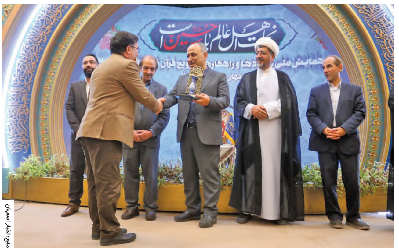
میچ: اخبار اصفهان

همایش ملی شیوه‌ها و راهکارهای ترویج قرآن کریم در فرهنگ برگزار شد؛