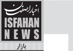
رئیس اتحادیه اغذیه و ساندویچ‌فروشان اصفهان: