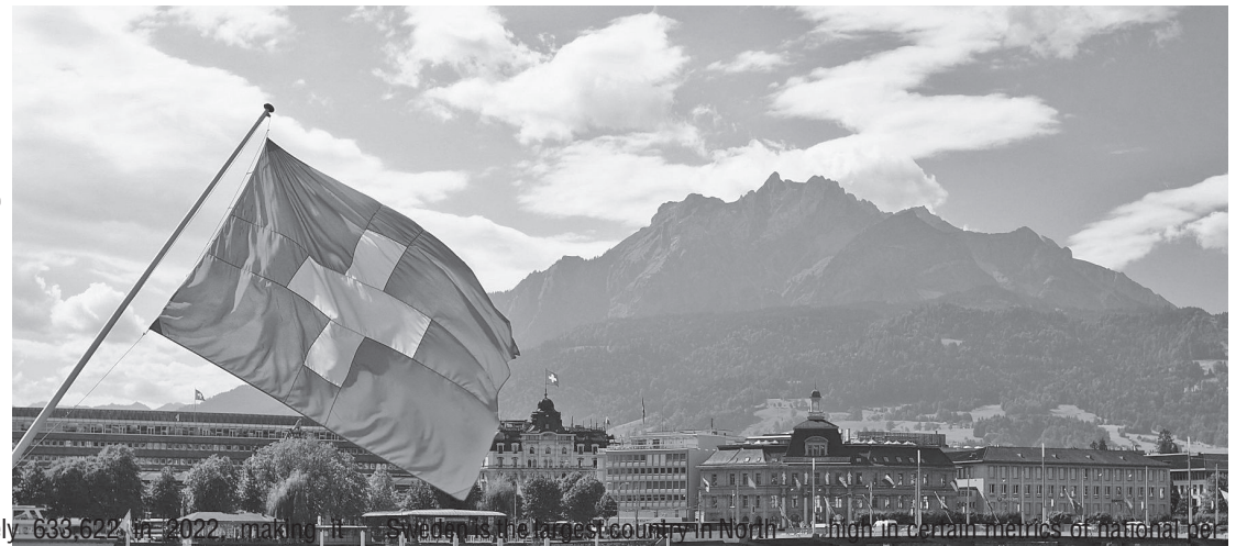
Sweden is the fifth cleanest country in the world in 2022, with an EPI score of 80.51. It is a Nordic country in Northern Europe, with an area of 450,295 square kilometers, the third largest country in the European Union, and is the fifth largest country in Europe. Sweden's capital and the largest city is Stockholm.

05. Sweden – EPI Score 80.51 With an EPI score of 80.51, Sweden ranks fifth among the top 10 cleanest countries in the world in 2022. It has consistently been on the list of the cleanest countries in the world for many years.