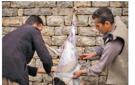
رئیس دامپزشکی شهرستان اردستان هشدار داد کشتار دام‌ها خارج از محیط کشتار گاهی خطر انتقال بیماری‌ها را با خود به همراه دارد.