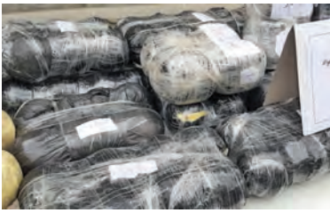
سرهنگ هادی کیان مهر، فرمانده نیروی انتظامی شهرستان نابین گفت: در این نمایشگاه کشفیات

شهرستان نابین در چهارراه مواصلاتی شرق استان اصفهان قرار دارد و هر ساله به همت و تلاش شبانه روزی نیروهای انتظامی، مقدار زیادی مواد مخدر و نیز کالاهای قاچاق در جاده‌های آن کشف و ضبط می‌شود.