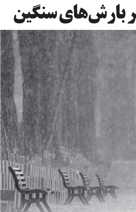
بارش در اصفهان

گفت و گو با معاون اداره کل هواشناسی استان اصفهان با محوریت یک پرسش؛ چرا در اصفهان نبارید؟