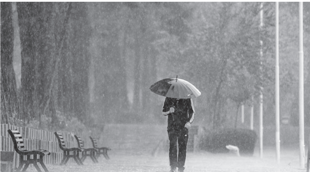
بارش در اصفهان