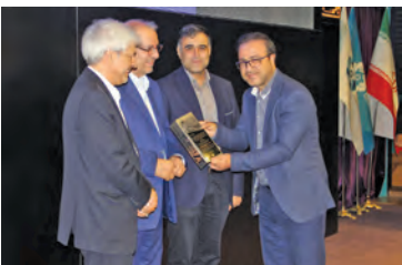
اخبار اصفهان شرکت گاز استان اصفهان عنوان «خلاق» جشنواره روابط عمومی‌های برتر استان را

در هفدهمین دوره جشنواره انجمن فرهنگی روابط عمومی‌های استان، این شرکت عملکرد خود را در حوزه فعالیت‌های روابط عمومی، در هفت محور شامل: روابط