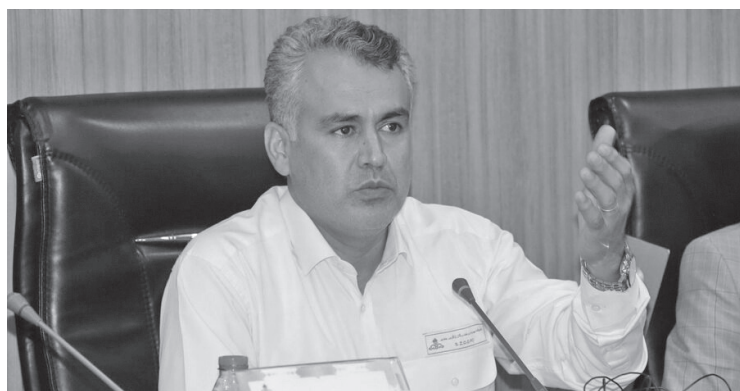
Managing director of Iranian Central Oil Fields Company (ICOFC) has said the company is tasked to implement a force major development project on