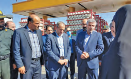
رئیس ستاد آزمون‌های استان اصفهان: