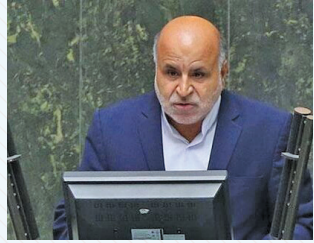
نماینده مردم نطنز، یادرد و بخش قمصر در مجلس، گفت: در بحث نهاده‌های دامی، دولت

کنند که باعث خوشحالی دامداران در حوزه نهاده‌های دامی شود. به گزارش ایسنا، نماینده مردم نطنز در مجلس، پیرامون مشکلات دارویی در داروخانه‌های شهرستان، گفت: با توجه به بدهی بیمارستان‌های شهرستان به شرکت‌های دارویی، شرکت‌ها از دادن نهاده‌های دامی نتوانسته دامداران را راضی کند و دامداران پیرامون این موضوع دل‌نگران هستند. وی افزود: امیدواریم دولت مصوبه‌ای را تصویب کند که دولت را در بحث نهاده‌های دامی، دولت