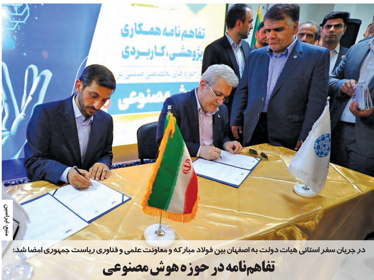
در جریان سفر استانی هیات دولت به اصفهان بین فولاد مبارک و معاونت علمی و فناوری ریاست جمهوری امضا شد: