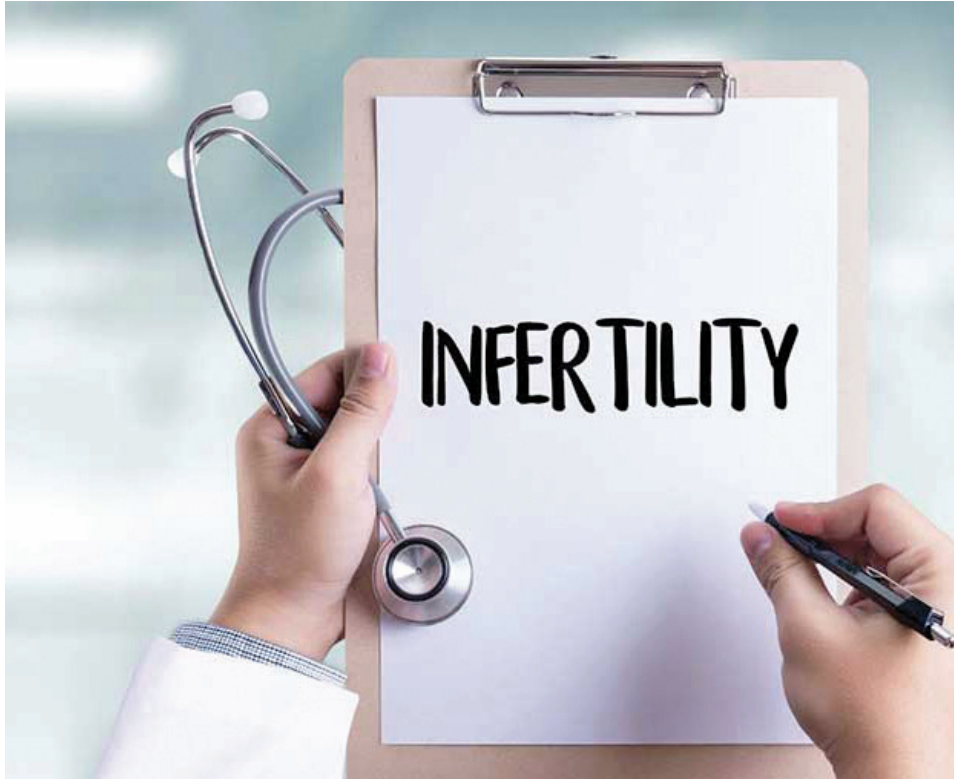
معاون امور زنان و خانواده ریاست جمهوری در اصفهان:

عین‌الهی ادامه داد: آمار کرونا در ایران به صفر رسید این در حالی است که در کشورهای غربی هنوز آمار فزونی وجود دارد. به گفته وی، علت موفقیت کشور در مقابله با کرونا، پیروی از منویات و رهنمودهای رهبر انقلاب بود.