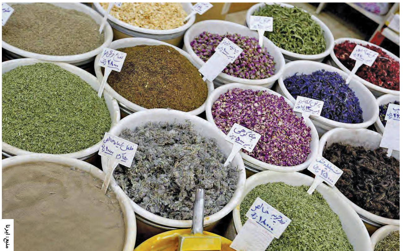
مدیر بازارهای روز سازمان میادین میوه و تره‌بار و ساماندهی مشاغل شهری شهرداری اصفهان خبر داد: