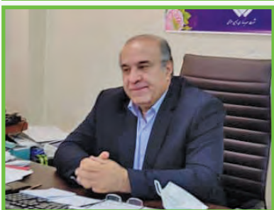
مدیرعامل شرکت فرآورده‌های نسوز ایران: