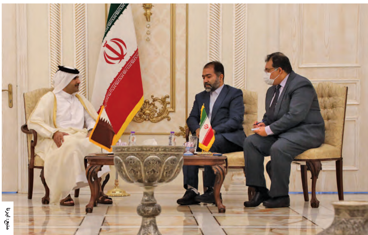
وزیر فرهنگ قطر: